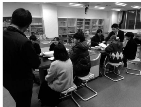
【写真4：「顔晴りの会」中等教育分科会】