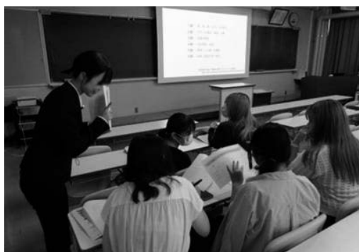
【写真8：教育実習報告会・情報交換会の様子】

人間栄養学科では、栄養教諭免許取得希望者には1年次から教育実習報告会及びその後の情報交換会への参加を必須とし、採用試験の現状認識と学力及び実践力を着実に向上させるための学修動機付けの機会としている。特に、情報交換会では、4年生が受験対策のポイントを具体的に説明した後、個別に質疑に応じるなど下級生の支援を行っている。