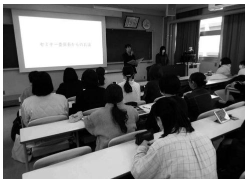
【写真1：春季セミナー（スタート会）】