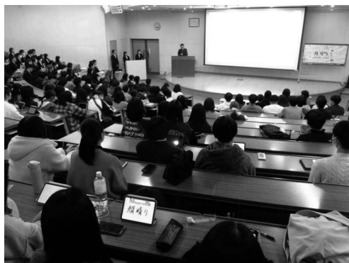
【写真3：「顔晴りの会」全体会】

本学では教員採用試験等の報告会を「顔晴りの会」と呼んでおり、本年は11月29日（金）16：30～19：00で行われた。全体会は大講義室で行い、その後の分科会は複数の教室に分かれて実施している。中等教育専攻の分科会は、1号館の理科演習室で行われた。