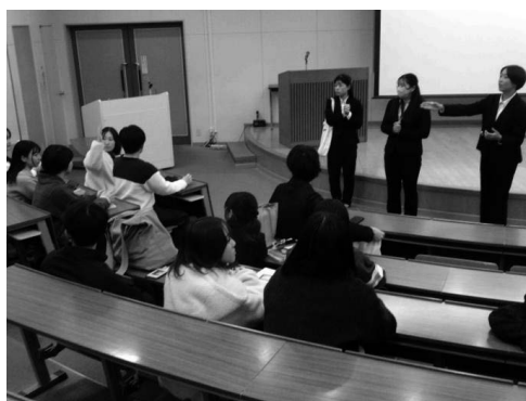
【写真5：「顔晴りの会」新旧セミナー委員との顔合わせ会】