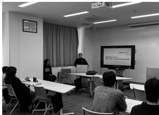
【写真6・7：自主勉強会「中等国語・顔晴りの会」の活動風景】