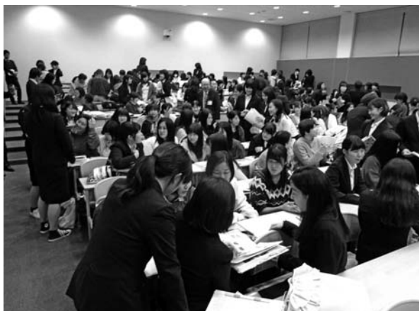
【写真9：「顔晴りの会」全体会の様子】

本学では、教員採用試験等報告会を「顔晴りの会」と呼ぶ。今年度は11月30日（金）5コマ目に本学641教室で実施された。例年通り、全体会、分科会の2部構成で行われた。