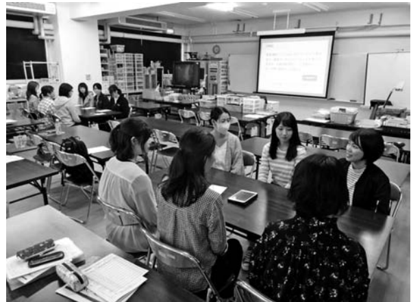
【写真4：前期・集団討論セミナー】