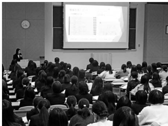
【写真10：「顔晴りの会」分科会の様子】

全体会では、セミナー委員の代表、教職センター長による挨拶の後、小学校教員採用試験受験者4人、栄養教諭1人、一般就職1人からの報告が行われた。