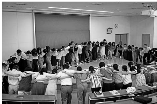
【写真5・6：夏期スタート会の様子】

夏期セミナーの内容は、模擬授業、面接練習 (表5) 、集団討論、音楽 (表6) 、体育実技等である。セミナー代表が学生・教員に事前調査を行い、セミナーの一覧表を作成する。一覧表は、印刷して学生・教員に配付する。その一覧を基に、複数の教室を使用してセミナーを同時展開する。一覧以外での支援も随時行われており、広島県・広島市の受験後（8月20日前後から）は学生の参加人数も少なくなるため、個別指導が中心となる。なお、一覧はセミナー委員が作成した表をもとに掲載したが、当日の変更については表に反映されていない。