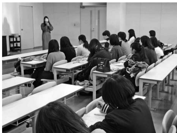
【写真1：春期スタート会】