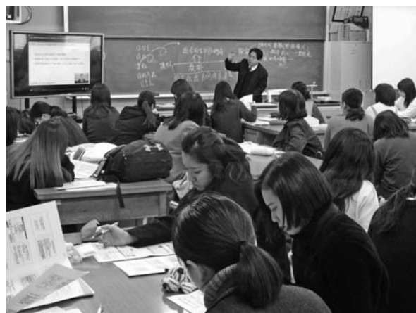
【写真2：春期・総合的な学習の時間セミナー】